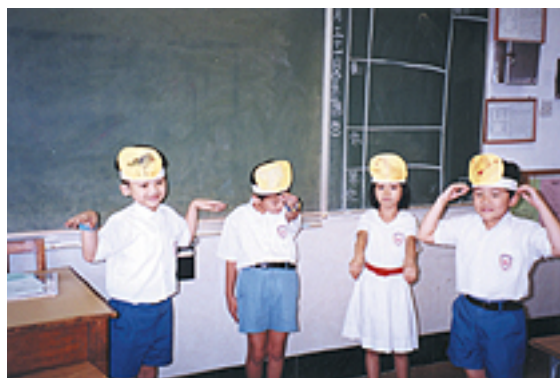
講故事真不容易呀！