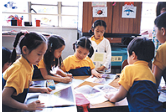
我們的「課本」真好看

保良局陳南昌夫人小學的教師爲了讓學生獲得更全面均衡的語文學習，學得更好、更愉快，在小學一年級做一個大膽的試驗——衝破「一本書」(課本)的束縛，由教師共同甄選一些學生更感興趣、更具啓發性的教材。他們首先訂立明確的中國語文學習目標，再根據這些學習目標精心挑選多本有趣的圖書作爲主要教材，以拓寬學生的閱讀面，增加他們的閱讀量。同時，又有系統地進行識字教學，讓學生在輕鬆