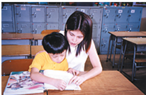
親子閱讀，伴我成長