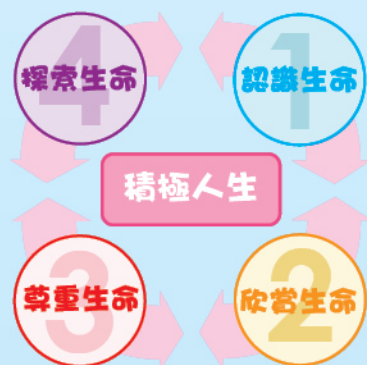
圖二：推行生命教育的四個學習層次

當學生能透過生活經歷和親身體驗，並懂得運用理性思考跨越逆境，就能夠進一步探索生命的意義。幫助學生認識和了解生命，有利於引發他們對生命的思考，探討生命與生活的關係。生命教育的推展可以劃分為(i)認識生命、(ii)欣賞生命、(iii)尊重生命及(iv)探索生命四個學習層次。通過這四個層次，讓學生掌握有關的價值信念：從認識生命的奇妙開始，肯定其價值（認識生命）；進而接納欣賞自己生命的轉變，愛惜生命（欣賞生命）；並學會關懷珍視他人，尊重生命（尊重生命）；最後做到追求生命理想，超越自我的生命探索階段（探索生命）。這四個層次內容各自獨立，同時又互有連繫、環環相扣（圖二）。