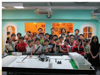
參與「我也是電腦遊戲設計師」的學員與導師合照

本組於暑假期間舉辦了一系列「馮漢柱資優教育中心增益試驗課程」，如「新世代·小領袖」、「機械人中的數學與科學」、「開心戲劇創思維」、「寫生水墨 雕塑」、「我也是電腦遊戲設計師」等，藉以豐富資優學生的學習經歷，並發展他們的資優潛質。