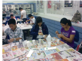
同學們進行實驗，測試不同岩石的成分。

「地球科學增潤課程2010」亦於9月25日(星期六)舉行實地考察活動，共有36位學生、家長、香港大學及教育局代表實地考察香港東平洲沿岸地勢及岩石。透過是次活動，學生能進一步學習和應用地質學知識。