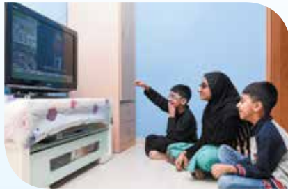
Panonood ng mga programa sa TV hal., cartoon, drama, balita