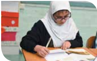
Pagbasa at pagsulat