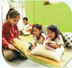
Mga gawain sa aklatan