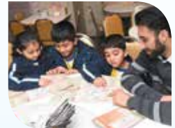
Pagbasa ng mga menu sa isang kainan upang mag-order ng pagkain