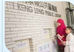
Pagpunta sa aklatan upang maghanap ng mga resource na naka-imprinta o sa multi-media