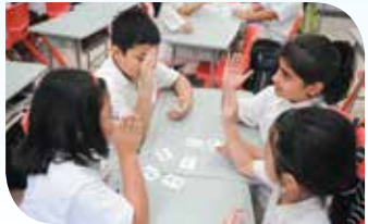
Mga laro gamit ang kard

aktibong pakikilahok sa mga gawaing pampagkatuto