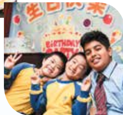
Mga handaan ng kaarawan