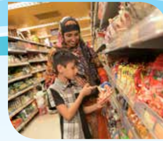
Pagbasa ng mga naka-tag na presyo o mga pakete, pag-aaral ng mga pangalan ng pagkain sa palengke upang piliin kung ano ang bibilhin