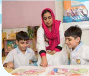
Pagbasa ng magulang-anak hal., mga aklat ng larawan, pahayagan