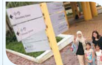
Pagbasa ng mga pangalan ng mga kalye o istasyon