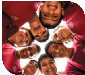
Mga larong bola