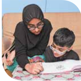
Mga nakatatandang kapatid bilang tagapagturo