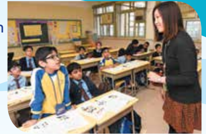
Mga pagtuturo pagkatapos ng klase