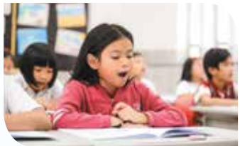
Pagbasa nang malakas