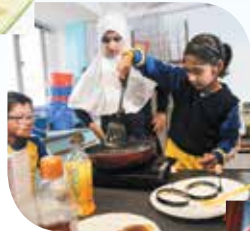
Klase ng pagluluto