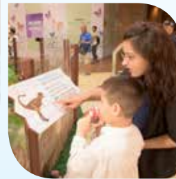
Pagbasa ng impormasyon habang namimili o bumibisita sa mga museo