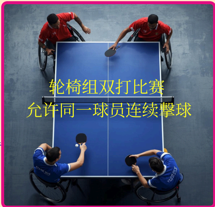
轮椅组双打比赛 允许同一球员连续擊球