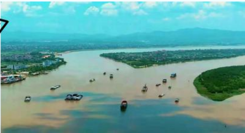
图一 我国主要河流的河盆 1