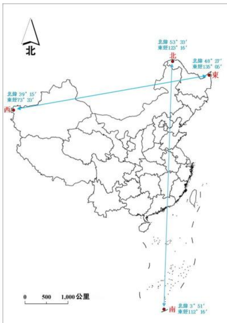
图一： 我国领土的四至点

地图资料来源：中华人民共和国自然资源部审图号 GS(2023)2763 号 (参考日期：2025 年 1 月 3 日)