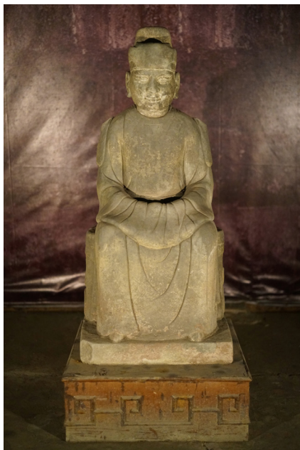
王建座像

此乃一小人座像，原立于几上。像下有淤泥，泥内含漆皮、小银片、石灰块、木纹土等，专家指出此造像或原放于矮木座上，木座腐朽后，落于淤泥之上 9 。