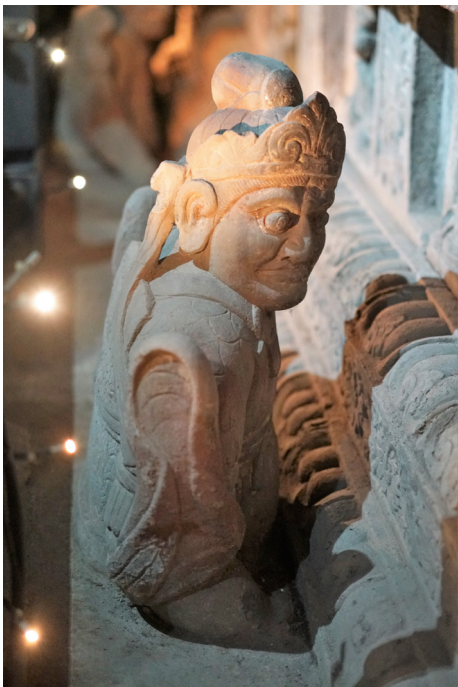
扶棺武士石雕