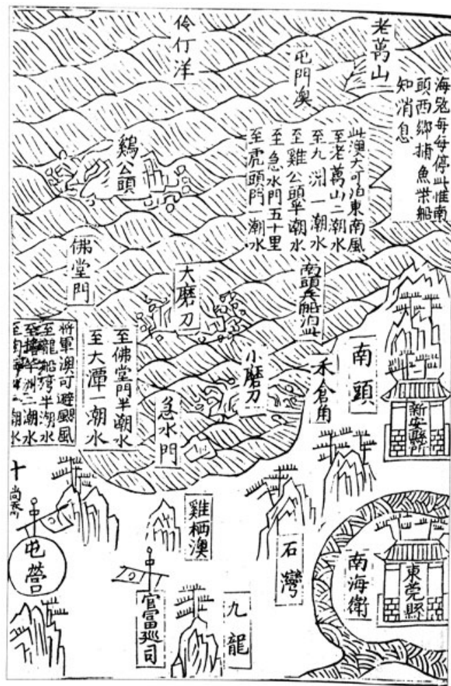
《苍梧总督军门志·全广海图》