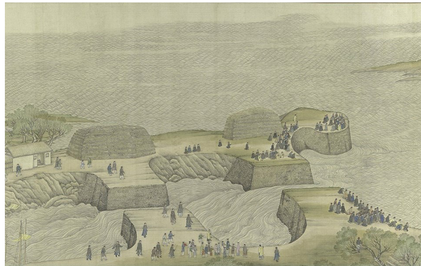
《康熙南巡图》（卷四）：视察黄河