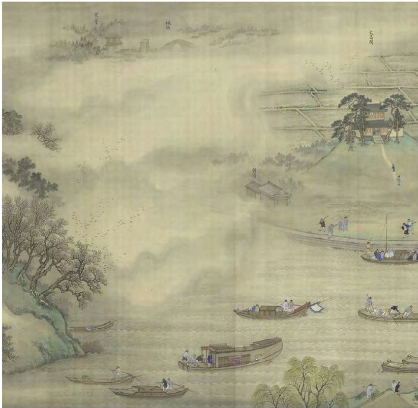
《康熙南巡图》寒山寺一带

无论是康熙还是乾隆出巡，都爱到江南名城，「杭州以湖山胜，苏州以市肆胜，扬州以园亭胜」 31 ，所以康、干每次出行定必到访三地，以苏州逗留时间最长。学者统计康、干二帝「十二次南巡，前后在苏州驻留一百一十四天，占整个南巡时间的十分之一以上」 32 。