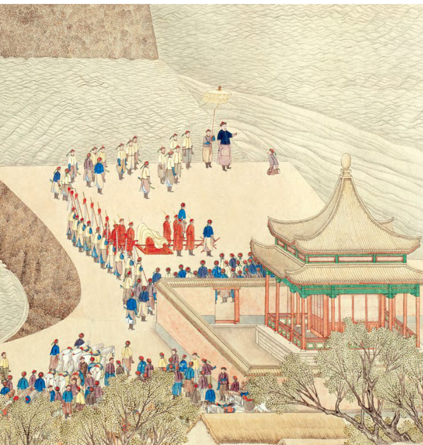
《乾隆南巡图》（卷四）：考察河工（局部）