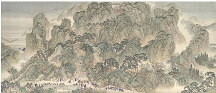
《康熙南巡图》（卷三）：泰山祭天