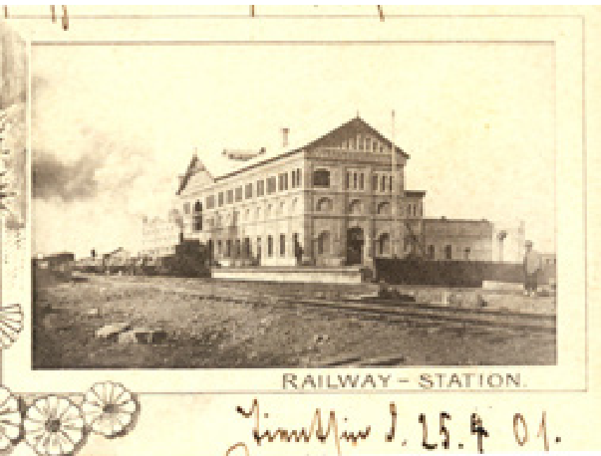
Peking railway station as depicted on a postcard mailed to Austria in April 1901. This is almost certainly the Ma Chia Pu (Majlabao) terminus destroyed by the Boxers in mid-June 1900

马家堡站（丰台火车站）于1900年6月中被义和团破坏