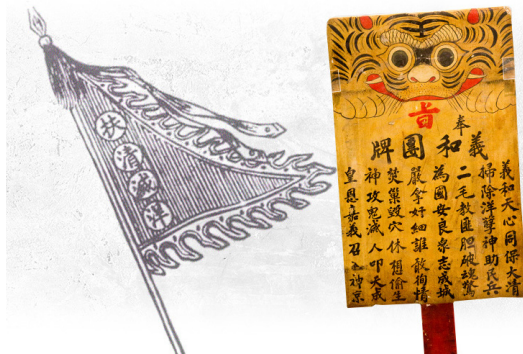
义和团团旗及团牌