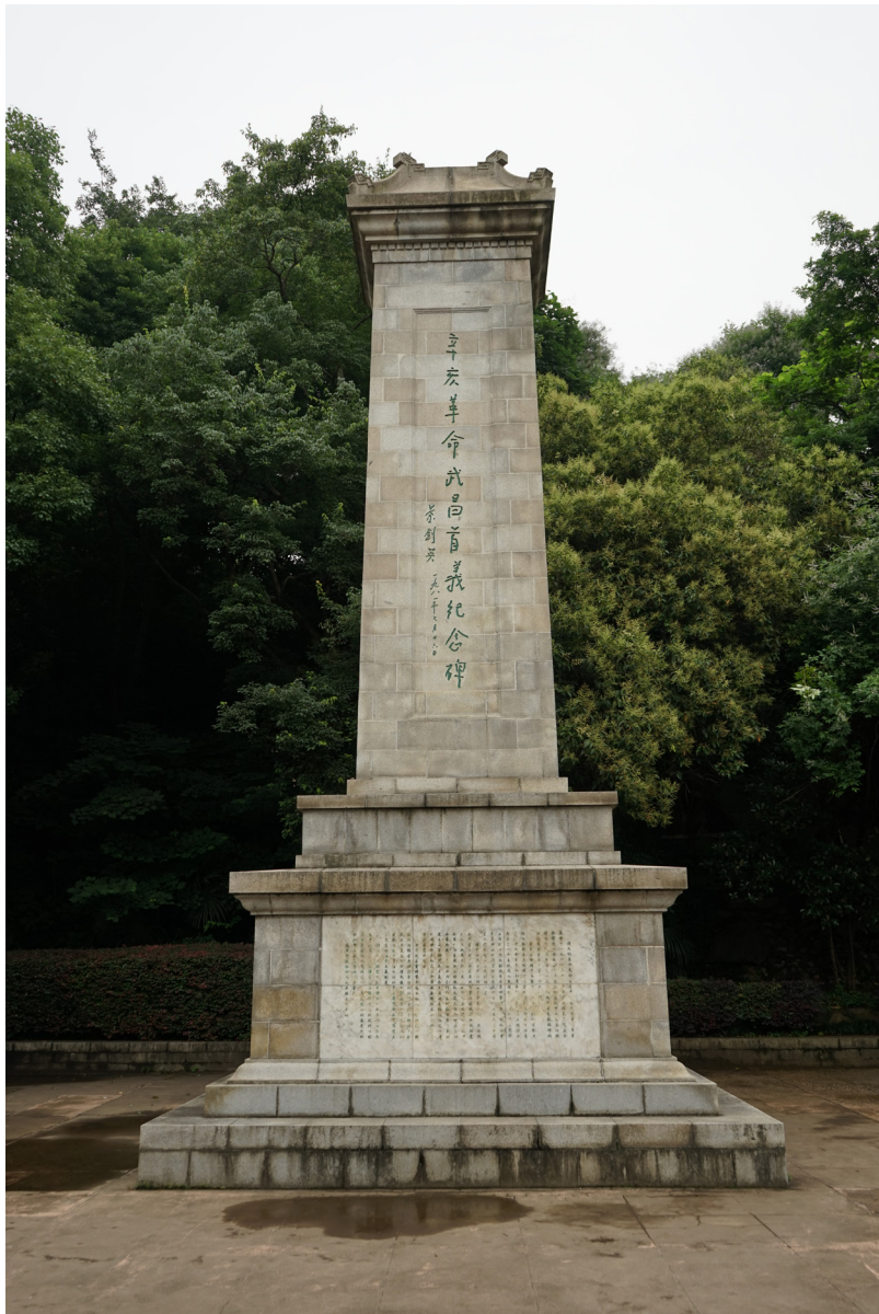
辛亥革命武昌首义纪念碑