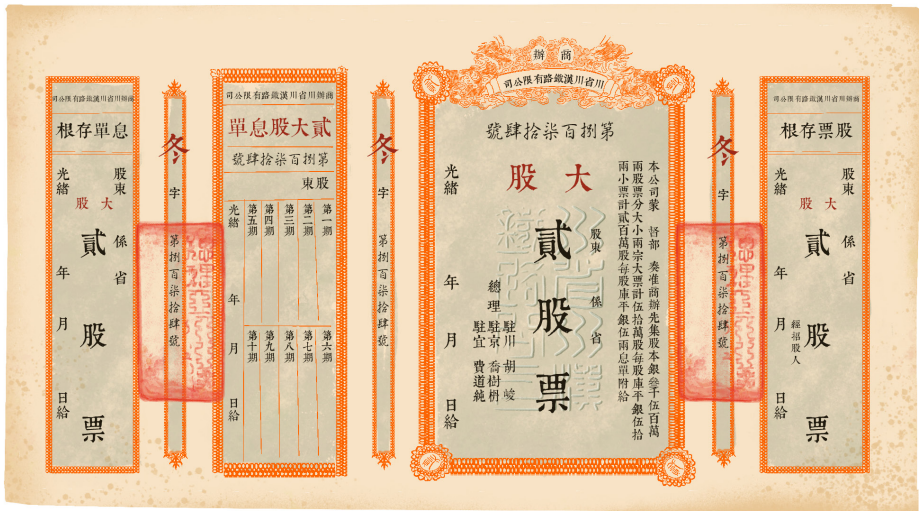
川汉铁路大股贰股票（重绘图）

川汉铁路大股贰股票是四川博物院所藏股票中，发行量最大、保存最齐全的股票 11 。川汉铁路大股贰股票顾名思义是商办川省川汉铁路有限公司筹备，以川汉铁路发行的其中一种大股票。「贰」为传统中国的数字，与「二」相通，即代表股数为两股。