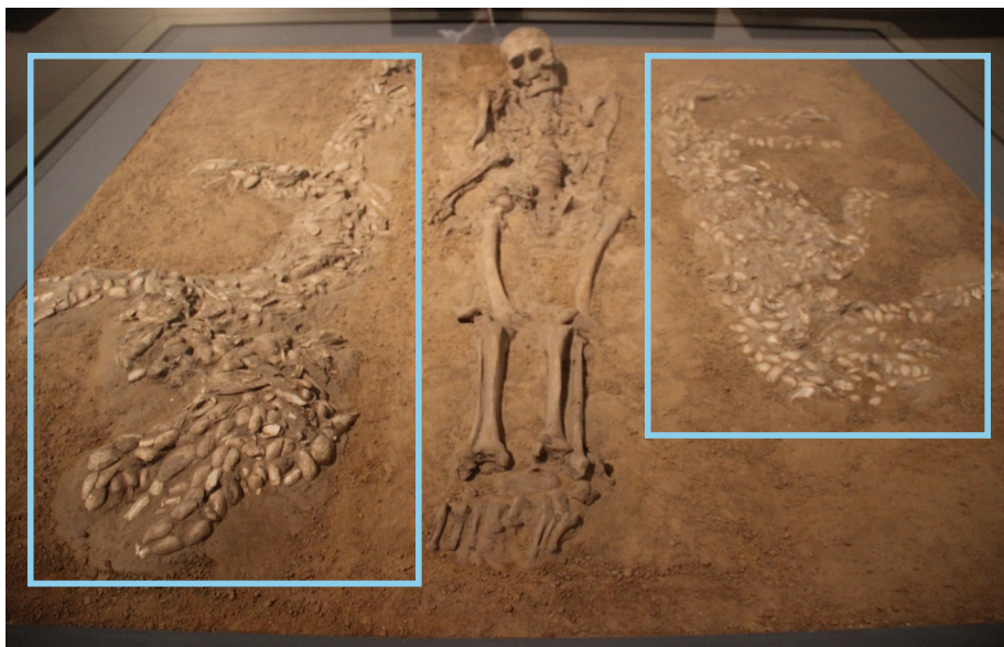
蚌壳堆塑的〈龙虎图〉

仰韶文化西水坡遗址位于河南省濮阳县城西南隅，累计发掘面积5000余平方米 21 。蚌壳堆塑的龙虎图是仰韶西水坡遗址最特别的墓葬，以贝壳堆砌成两种动物形态，死者置中，贝壳对陈列两侧。对于它们的构成，学者众说纷纭 22 ，但普遍认为该图属宗教性质 23 。除此之外大部分墓葬并无随葬品，不强调财富私有，随葬品中以生活用具最普遍，其次才是生产工具和装饰品，基本上呈现出平等的地位 24 。可见当时的社会状况较为简单，无社会分层问题。