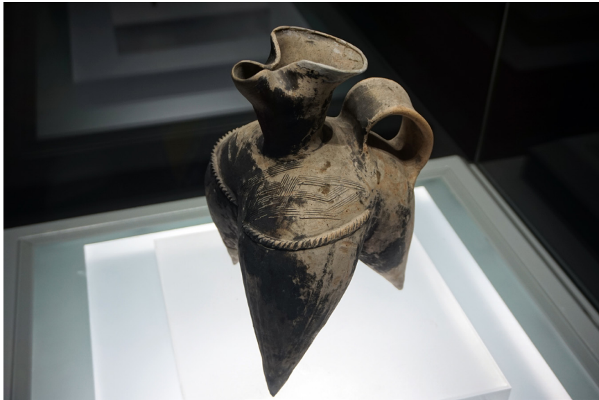
黑陶足陶鬶

长江流域文化出土的陶器以黑陶为主，黑陶的胎壁薄而规整，刻划纹最常见的是线条，有斜纹、旋转纹等几何花纹 35 ，参见黑陶足陶鬶。该器造型典型，出土于雀幕桥遗址，现存嘉兴市博物馆。陶鬶颈细，身肥大，三足，有把，似是动物弯曲的尾部，或为温酒器或盛酒器。器身有直线与横线条文，形成几何形状，学者认为这些刻纹乃探索中国文字起源的重要线索 36 。