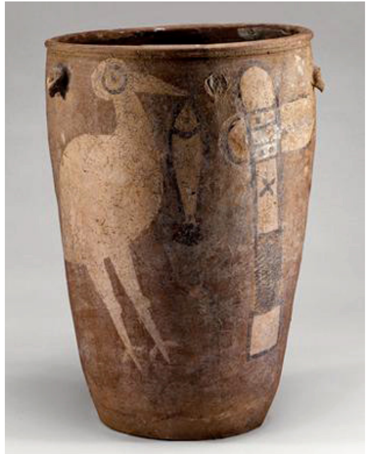
鹤鱼石斧陶缸