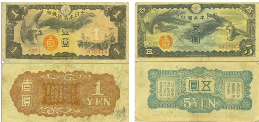
一元军票