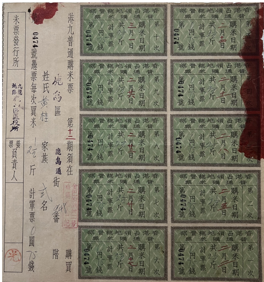
港九普通购米票正面