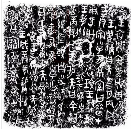
何尊铭文拓本

尊是酒器一种。何尊刻有铭文12行，总长122字，因底部破孔，残损3字，现存119字，记录了成王对何的训示。在1963年出土于陕西省宝鸡市郊。