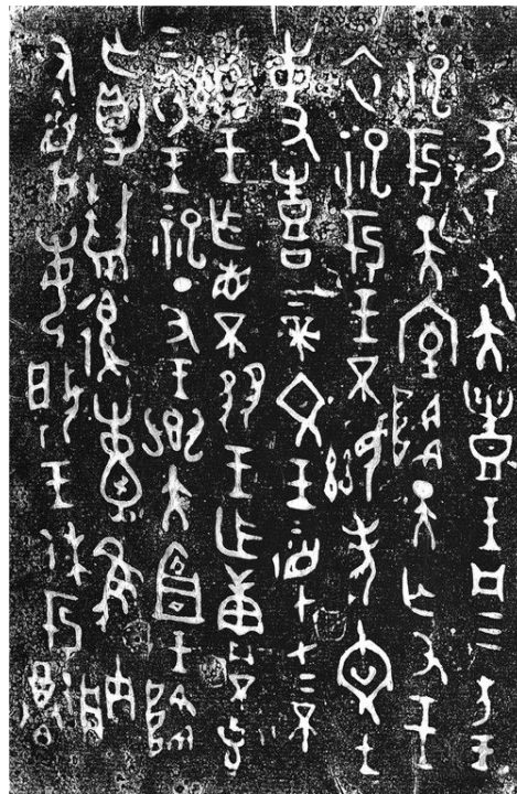
天亡簋铭文拓本

天亡簋与利簋同是西周初最早的青铜器，其内容可补足利簋所言武王到管地之由，又反映了周初的天命观。天亡簋是在清道光末年出土于陕西西岐山，器体有8行，共77字。