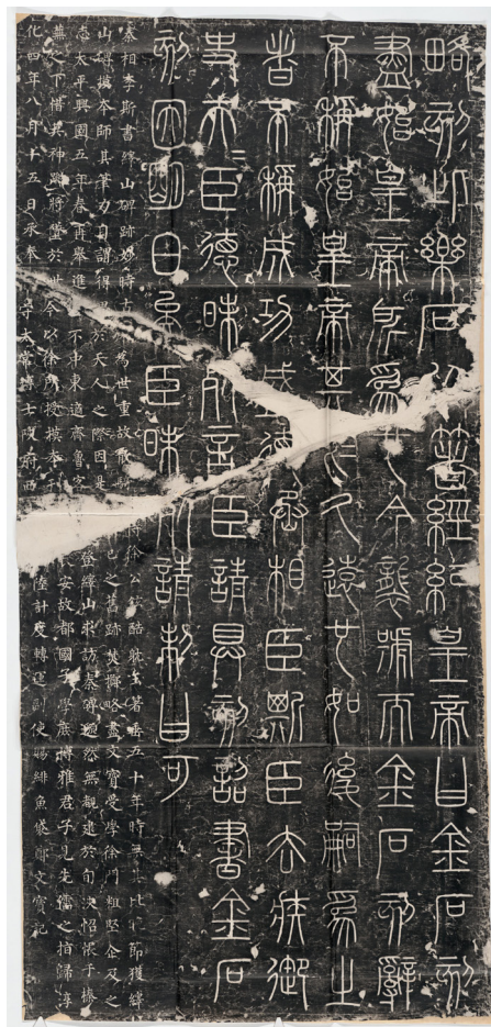
峰山刻石

不仅如此，泰山刻石 14 、琅邪刻石 15 、碣石刻石 16 、之罘刻石 17 陈述秦始皇夙兴夜寐、亲力亲为、勤政爱民，把天下打理得井井有条，他的个人魅力感化群臣，让他们心悦诚服。