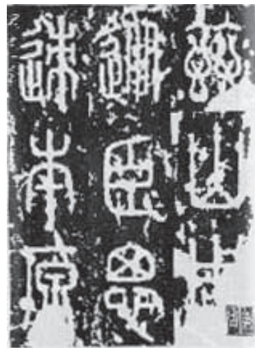
《秦泰山刻石》拓本