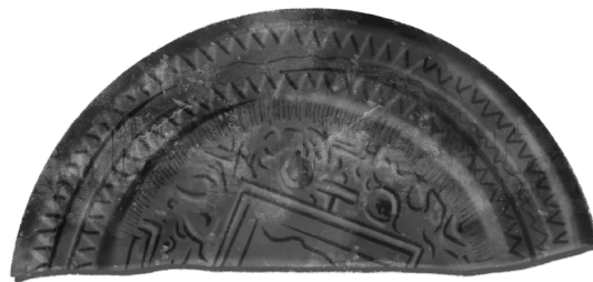
铜镜残片 (重绘图，图片来源：潘玲、萨仁毕力格：《匈奴大型墓葬概述》，《草原文物》，2015年02期，页100-109)