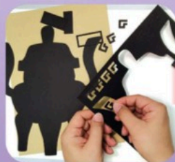
1. 取下配件进行拼贴