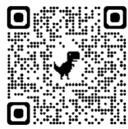
「共建更好的網絡世界」 電子學習資源套