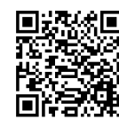
「樂諾小太陽」 Facebook 專頁