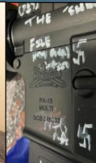
2022年 美國水牛城槍擊案