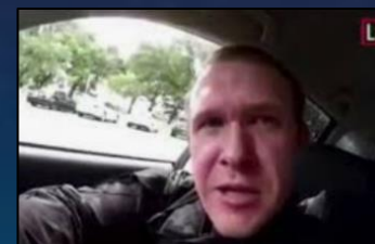
2019年 新西蘭基督城槍擊案