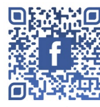
羅氏慈善基金 FACEBOOK 專頁