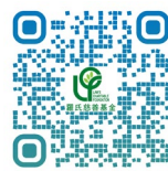
羅氏慈善基金 網頁