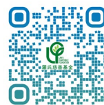
羅氏慈善基金 網頁

請瀏覽羅氏慈善基金網頁( www.lawscharitable.org.hk )。