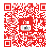
羅氏慈善基金 YouTube 頻道