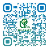
羅氏慈善基金 網頁

羅氏慈善基金 地址:九龍荔枝角長順街7號西頓中心2303室 電話:3605 2081 傳真:3020 6179 電郵地址: APL@lawscharitable.org.hk