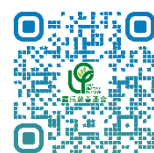
羅氏慈善基金 網頁