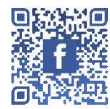
羅氏慈善基金 FACEBOOK 專頁