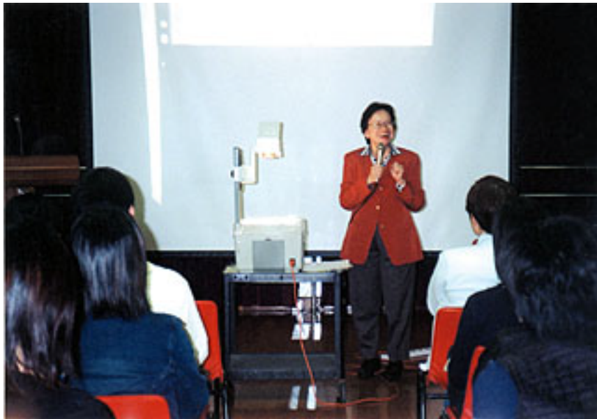
專家向家長講解創意閱讀法