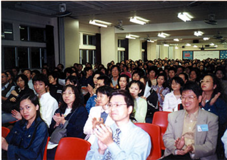
家長踴躍參加創意閱讀法講座