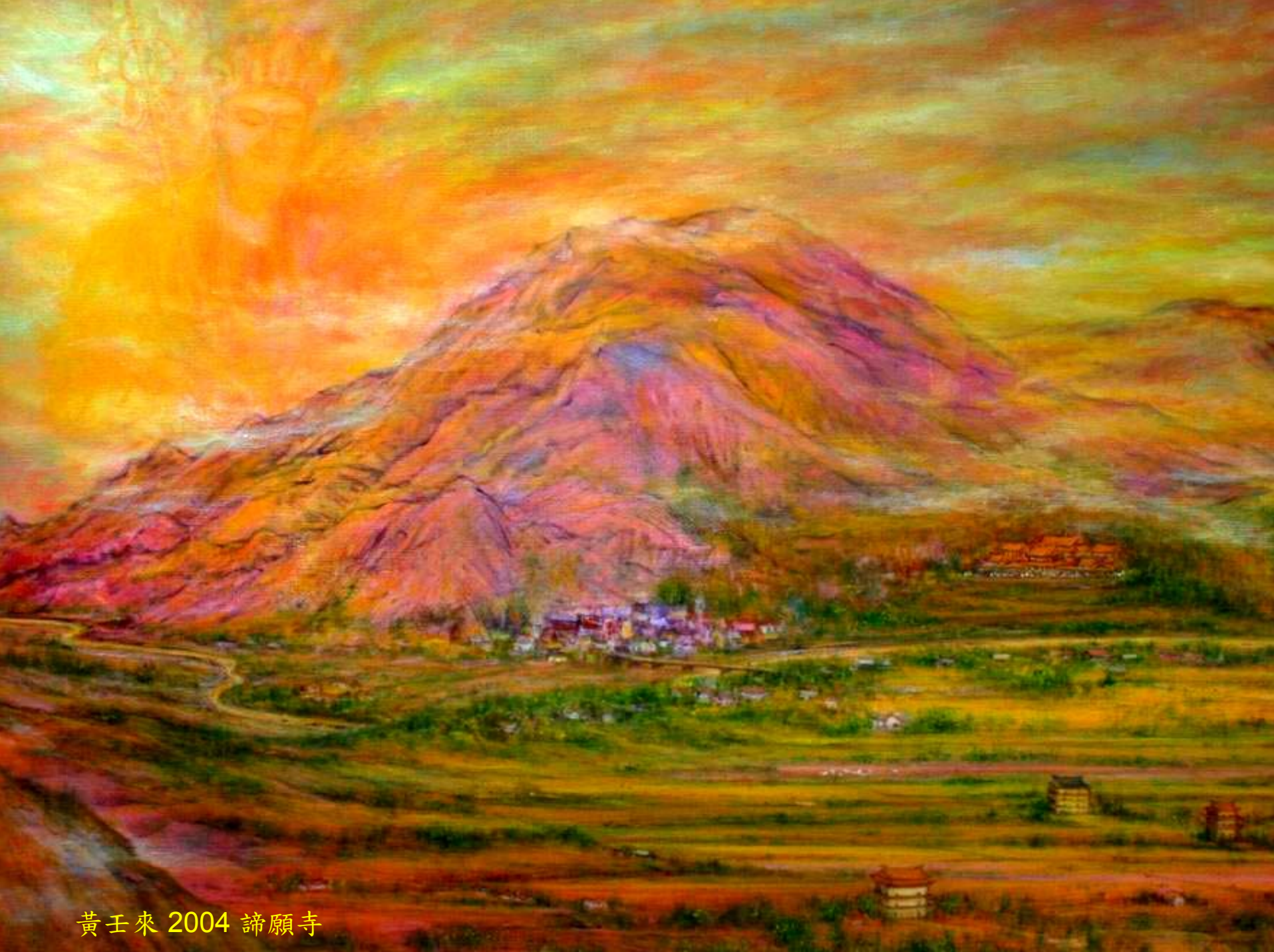
黃壬來 2004 諦願寺