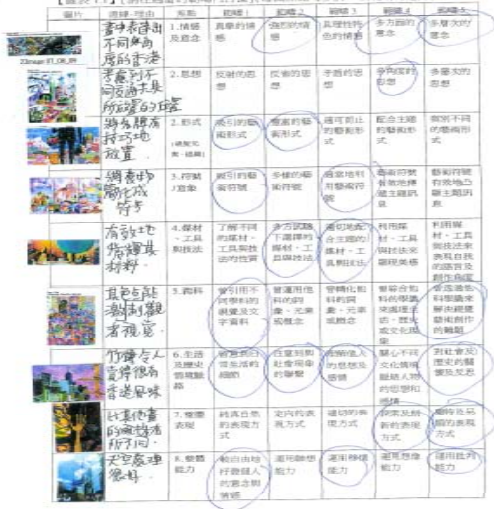
【圖表 1】【請在適當的範疇內打圈】(每個焦點可多於一項範疇的選擇)