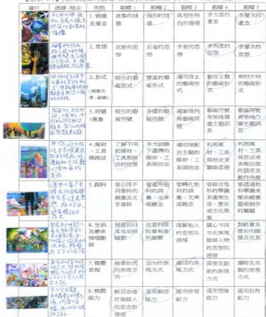
【圖表 1.1】(請在適當的範疇內打圈)(每個焦點可多於一項範疇的選擇)