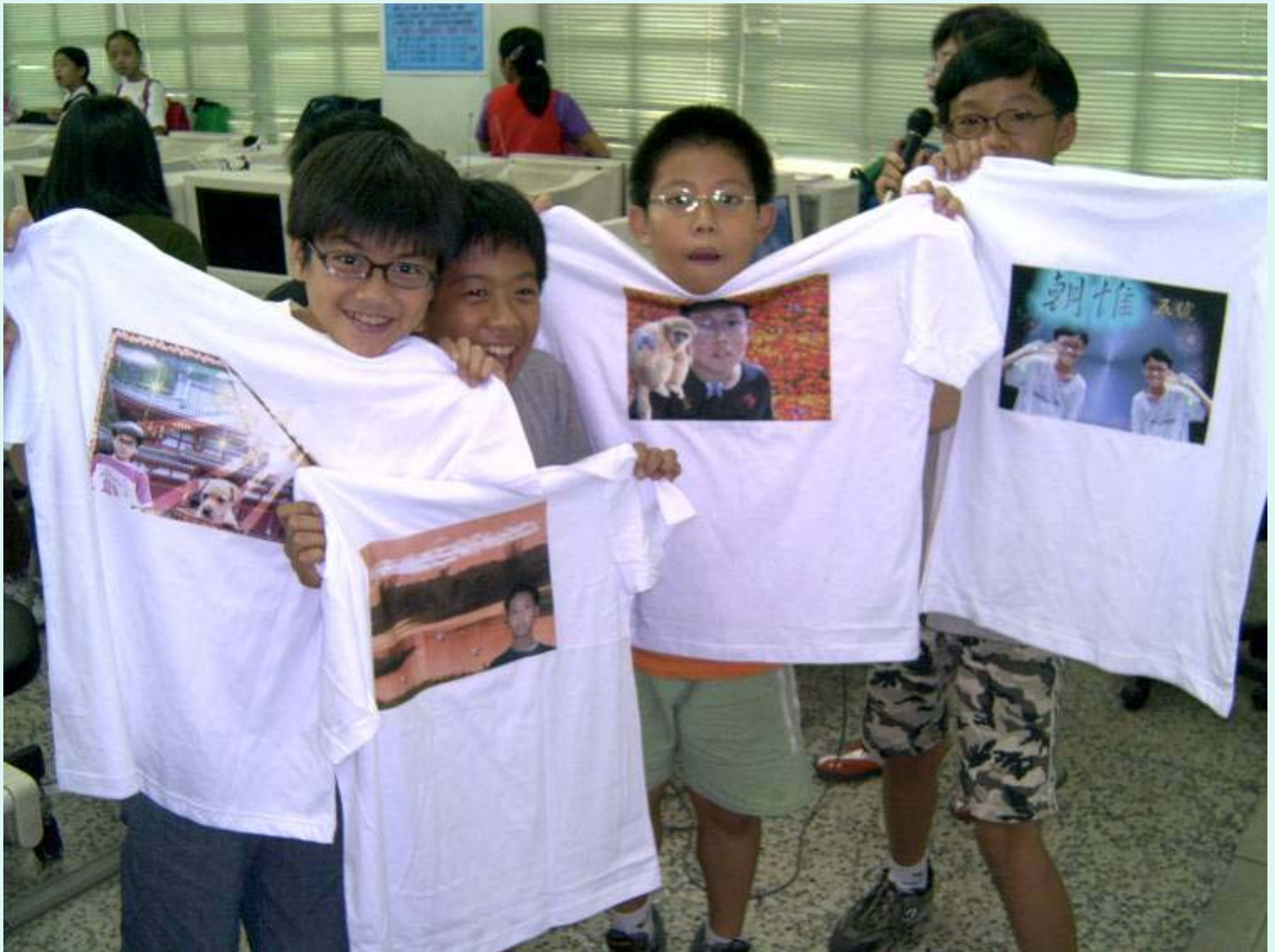
學生興奮地展現學習成果