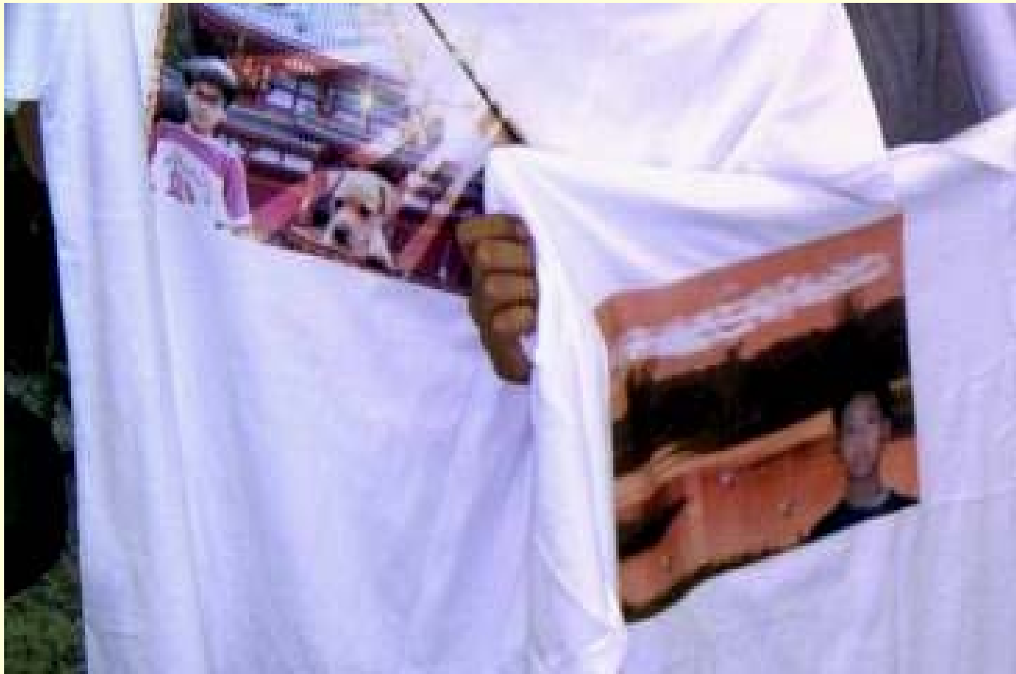
資訊科技融入視覺藝術教學成果