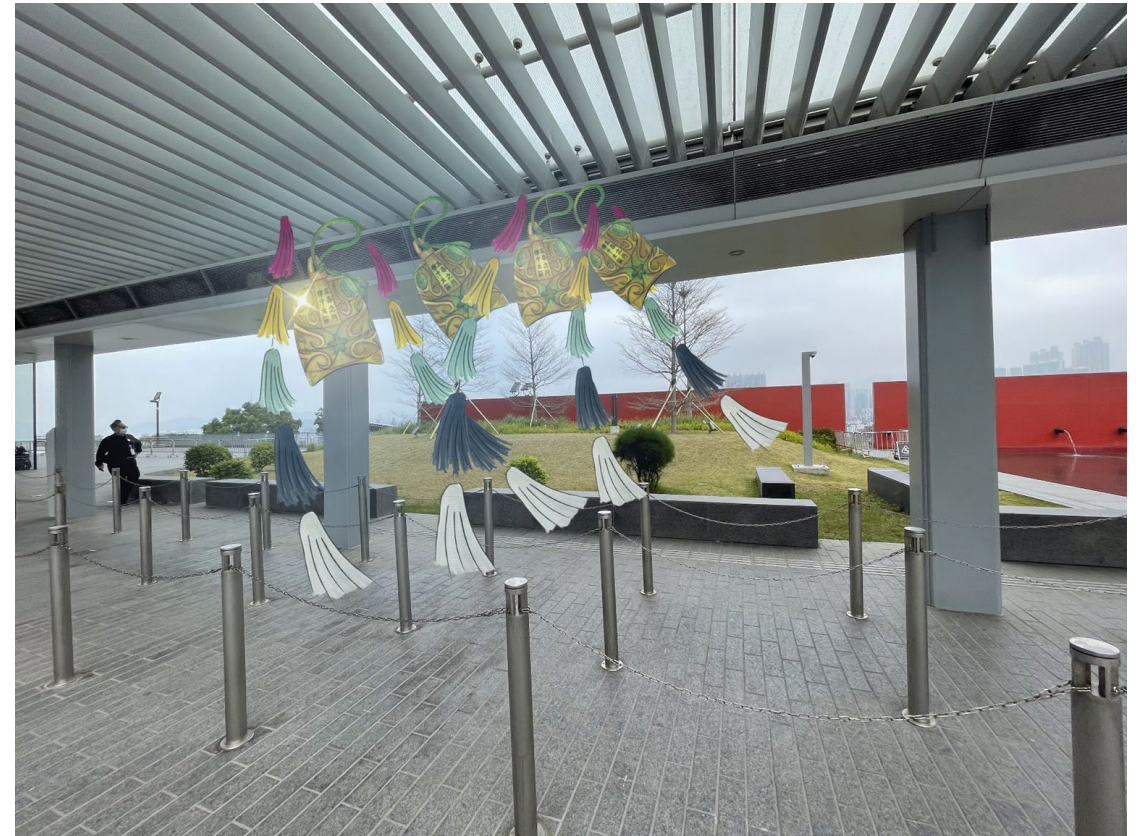
最初的环境模拟圖