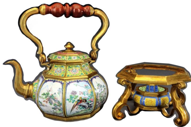
該作品參考了琺瑯八棱提梁壺

本作品使用了更節能的LED燈泡來達到更節能的效果，然後在STEAM設計中使用了大量不同的柱子，並使用了大量的數學計算來作在層座的八邊形設計。再以塑膠彩特出明黃色及青藍色的對比，帶出有皇帝和貴族的氣色，也使用了對稱構圖，令觀眾有平和的感覺，加強穩重的感覺，並在整體作品以八邊形帶來吉祥平和的寓意。