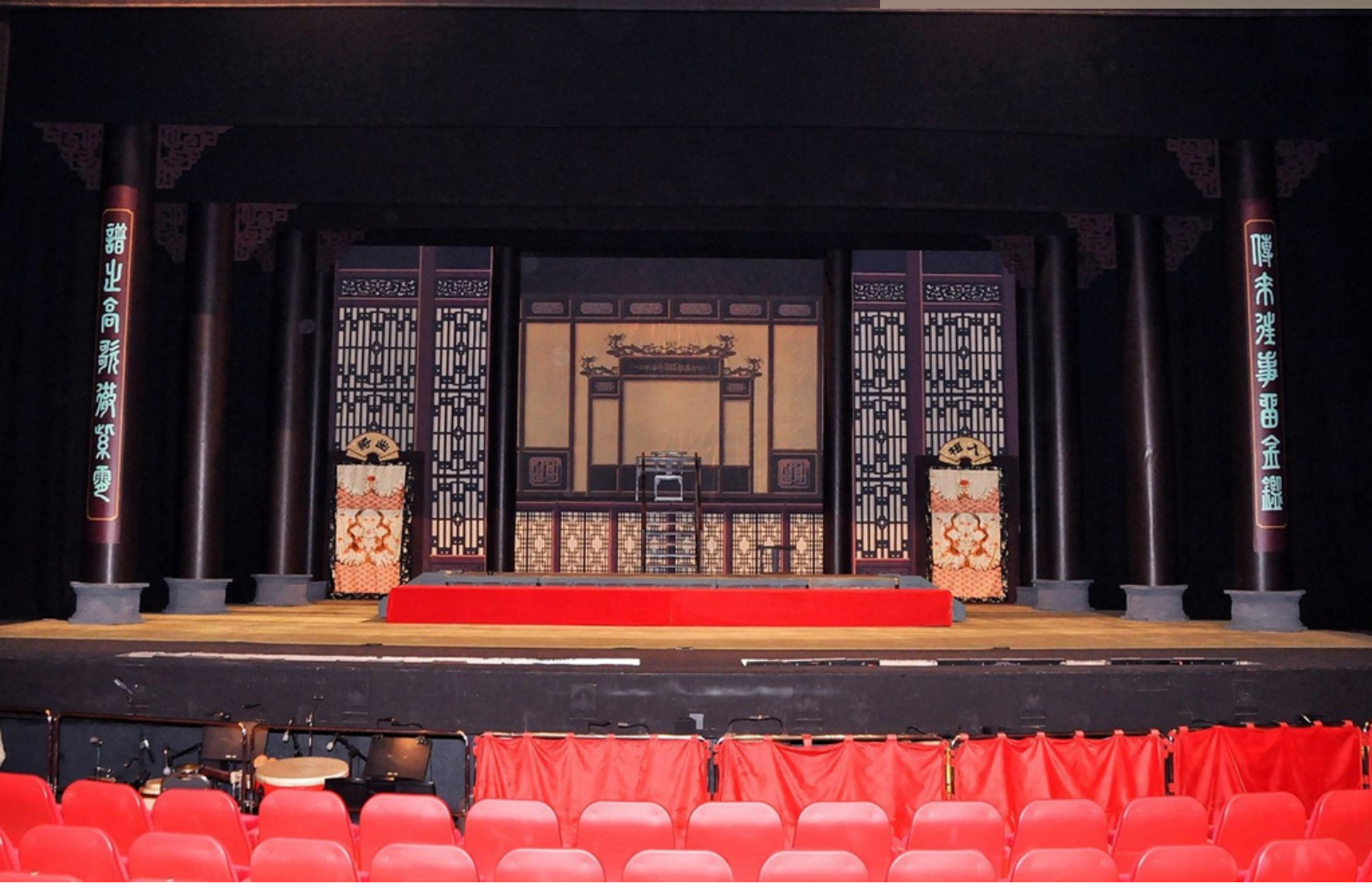
現代劇院內的粵劇演出佈景

根據《保護非物質文化遺產公約》，「『非物質文化遺產』，指被各社區、群體，有時是個人，視為其文化遺產組成部分的各種社會實踐、觀念表達、表現形式、知識、技能以及相關的工具、實物、手工藝品和文化場所。這種非物質文化遺產世代相傳，在各社區和群體適應周圍環境以及與自然和歷史的互動中，被不斷地再創造，為這些社區和群體提供認同感和持續感，從而增強對文化多樣性和人類創造力的尊重。」