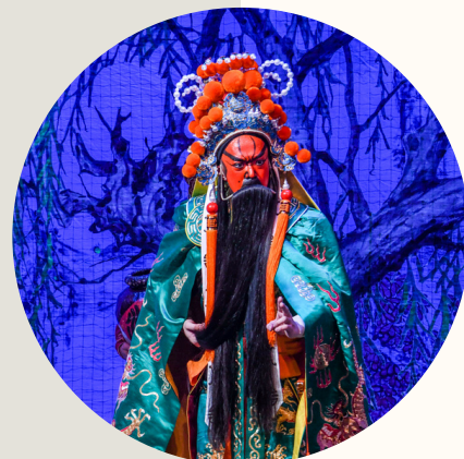
■ 紅面：《曹操·關羽·貂蟬》 吳國華飾演關羽