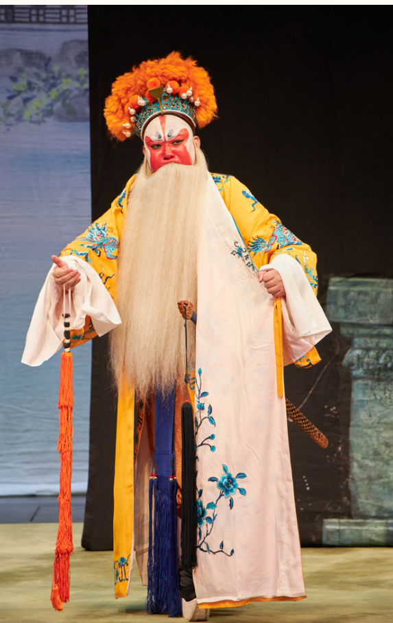
■ 《紫釵記》劍麟飾演黃衫客