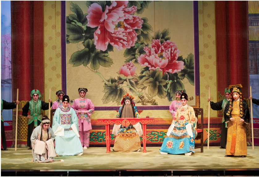
2021-22年粵劇新秀演出系列《紫釵記》劇照