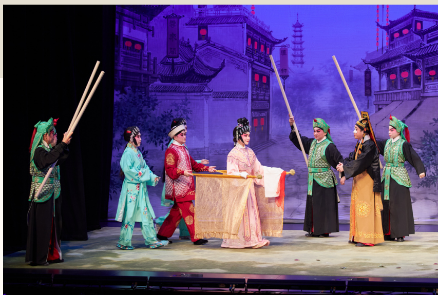
■ 2021-22年粵劇新秀演出系列《紫釵記》劇照

古時的交通工具主要以馬、船、轎和車為主。表演時，演員會以一支貼滿絮絲的藤枝作馬鞭，拿著馬鞭即代表騎馬，而上馬、落馬都有特定的程式。演員亦會用兩支車旗來象徵「轎」或「車」，在旗中間的演員即代表正坐轎或車。至於划船，則會以撥動一支船槳來表達。