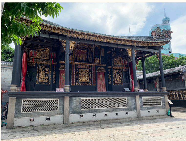
■ 佛山祖廟內的古戲台

粵劇已有百多年歷史，2009年9月獲聯合國教育、科學及文化組織列入《人類非物質文化遺產代表作名錄》，為香港首項獲得此殊榮的表演藝術。