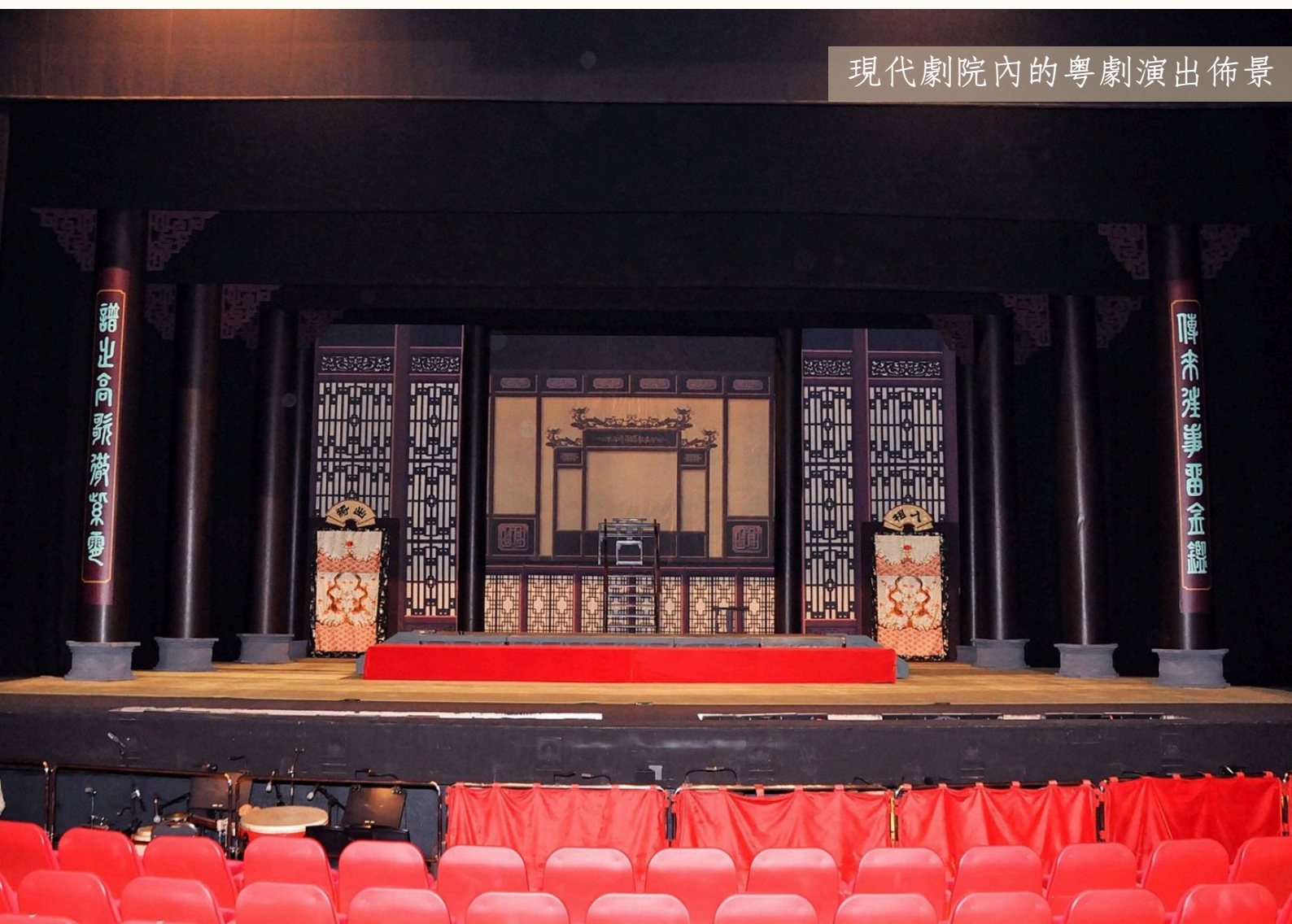
現代劇院內的粵劇演出佈景

根據《保護非物質文化遺產公約》，「『非物質文化遺產』，指被各社區、群體，有時是個人，視為其文化遺產組成部分的各種社會實踐、觀念表達、表現形式、知識、技能，以及相關的工具、實物、手工藝品和文化場所。這種非物質文化遺產世代相傳，在各社區和群體適應周圍環境以及與自然和歷史的互動中，被不斷地再創造，為這些社區和群體提供認同感和持續感，從而增強對文化多樣性和人類創造力的尊重。」