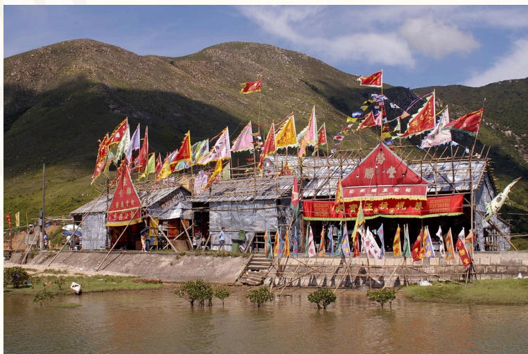
■ 以竹搭建的神功戲戲棚