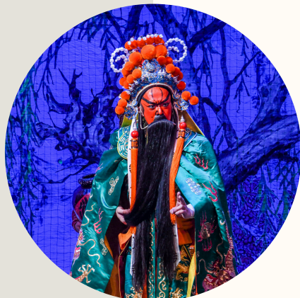
■ 紅面：《曹操·關羽·貂蟬》 吳國華飾演關羽