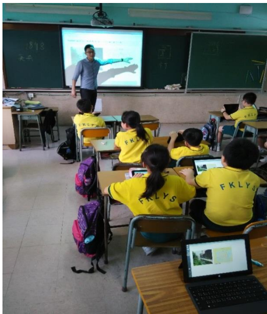
同學專心聆聽老師的講解，並借助電子器材促進學習。