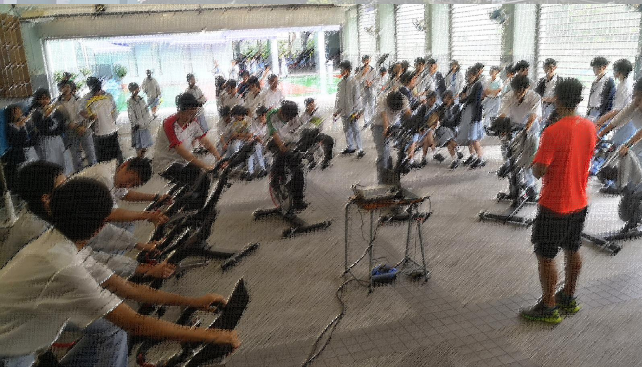
照片為疫情前拍攝