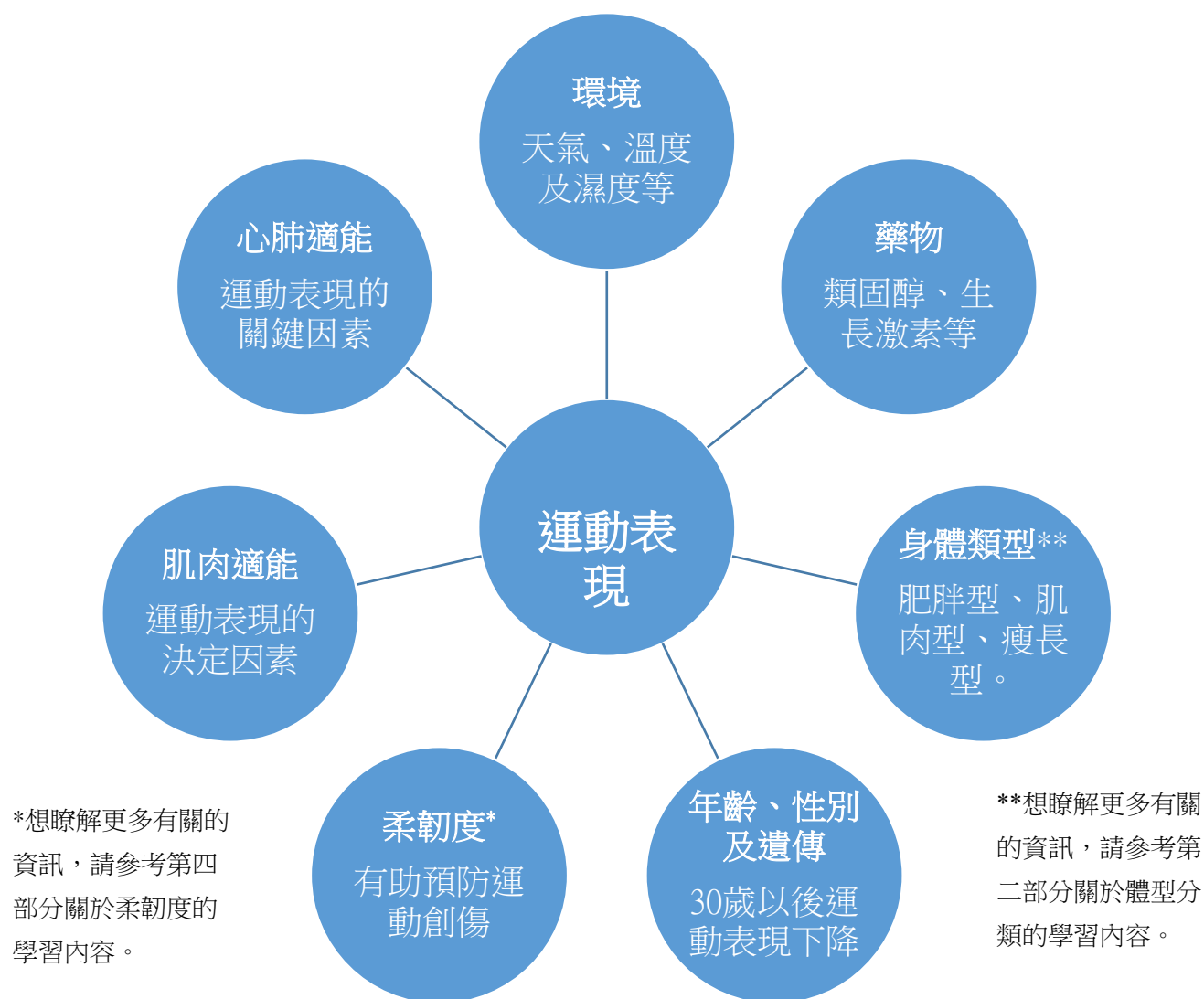
圖 5.1 影響運動表現的主要因素

不同的環境會令人產生不同的生理反應，如在高原環境中，因氧氣含量較稀薄，人體攝取氧的能力便會降低，形成高原缺氧情況；但如在高原環境生活一段時間，便會刺激身體作出反應，增加紅血球數目和血紅蛋白，提升人體的帶氧能力。所以，有一些運動員在參與大型比賽前，會進行「高原訓練」，以提升他們在競賽中的表現。