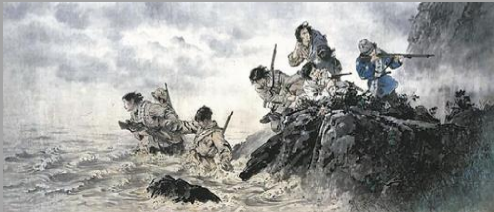
中國畫大師王盛烈1957年創作的 《八女投江》