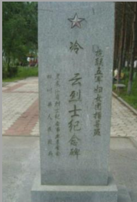
「八女投江」帶頭人—— 烈士冷雲的紀念碑