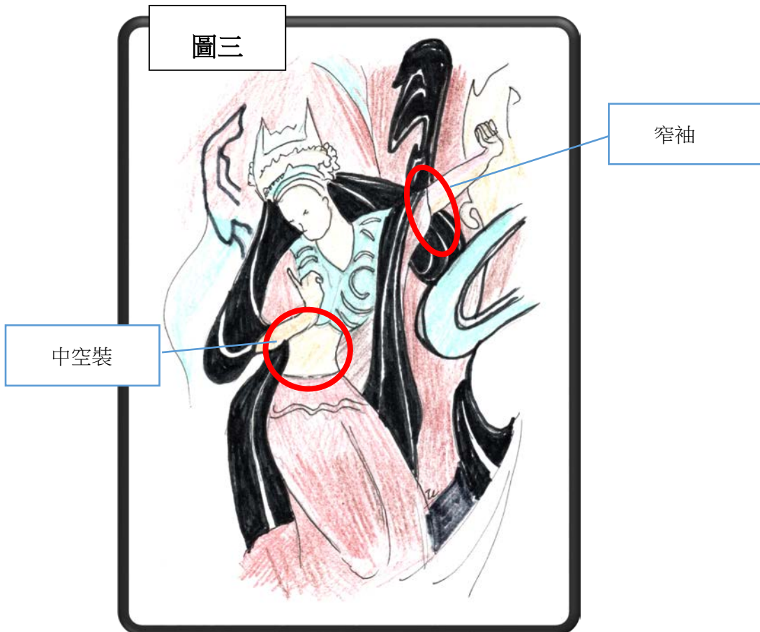
北魏(386-534年)第257窟須摩提女姻緣局部(重繪)