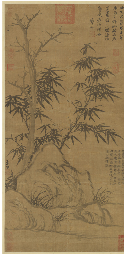
趙孟頫《窠木竹石圖》