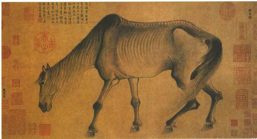
龔開《瘦馬圖》

趙孟頫尚且「官運亨通」，但始終只是少數，許多文人，如龔開不仕，留在南方以賣畫為生。龔開《瘦馬圖》的馬與趙氏所畫的馬外形、神態都有巨大的分別。《瘦馬圖》顧名思義是一隻瘦馬，馬頭低垂，神態萎靡，身體骨感明顯，似皮包骨的狀態，展示該馬長期飢餓，處於壓迫中。畫中的馬是龔開的自況，寓意自己在蒙古族的統治下生活困苦，且壯志未酬 17 ，有如畫中瘦馬一般。然而，龔開顯然並不後悔自己的決定，這點也寄語在畫中，馬是意志堅定的動物，無論生活多麼殘酷，自己也不會改變初衷，為生計而受當時朝廷的奴役。