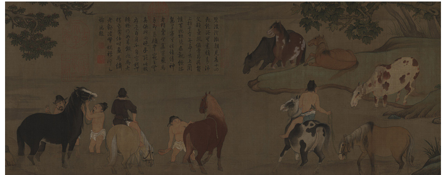
趙孟頫《浴馬圖》卷