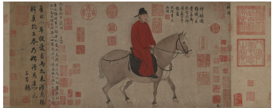
趙孟頫《人騎圖》