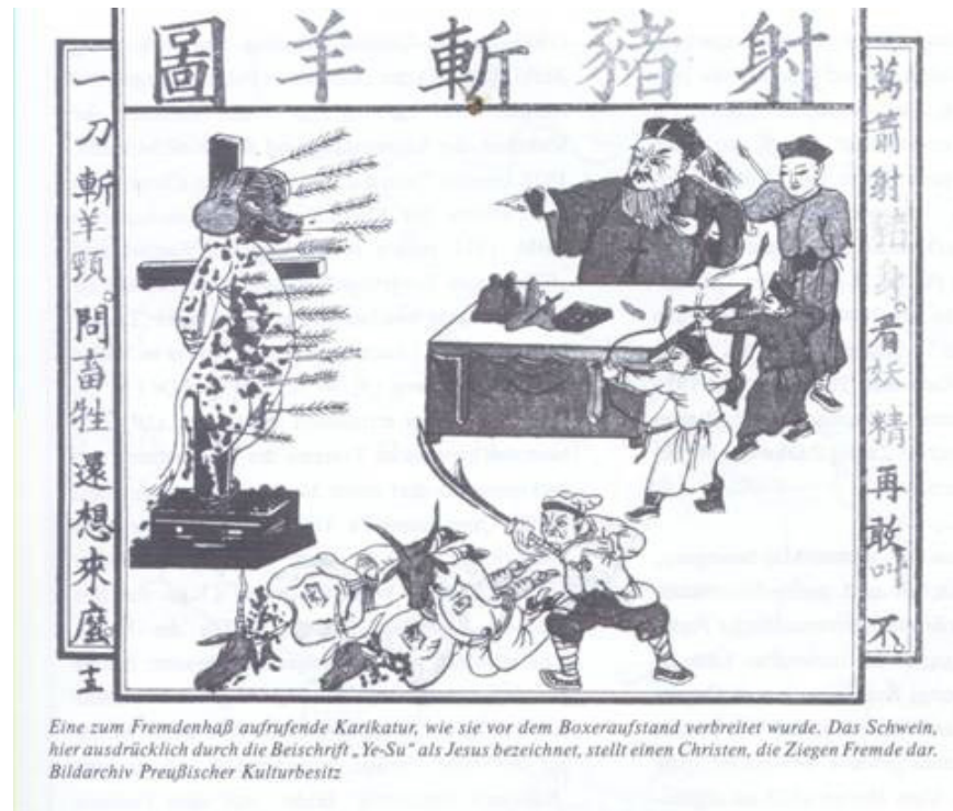
Eine zum Fremdenhaß aufrufende Karikatur, wie sie vor dem Boxeraufstand verbreitet wurde. Das Schwein, hier ausdrücklich durch die Beschriftung „Ye-Su“ als Jesus bezeichnet, stellt einen Christen, die Ziegen Fremde dar.