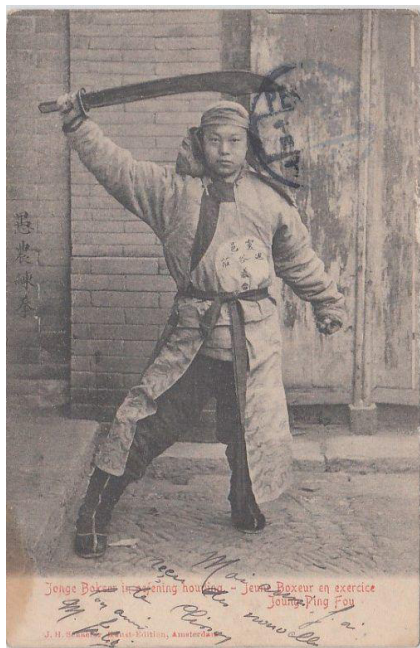
義和團拳民

義和團發源於山東省 1 ，最初為民間操練武術的反清組織 2 。義和團第一次出現在官方記錄，被視為白蓮邪教苟延殘喘的勢力，因此屢被打壓 3 。1900年三、四月間，組織在直隸省迅速發展壯大起來，天津成為了成員活動的中心地區 4 。義和團拳民吹噓自己「刀槍不入」，無懼洋槍。慈禧認為可發展其為抗洋勢力，故在同年六月將其收攏，義和團轉為「扶清滅洋」。下文將以三項文物：團牌、《射豬斬羊圖》、《神助拳》揭帖，述說義和團的特點，以及其與1900年八國聯軍之役的關係。