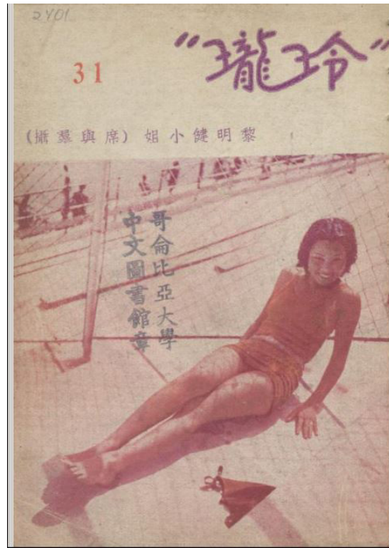
《玲瓏》298期封面影星黎明健

1932年，全國女學生共計106793人 29 ，而上海的女性受教育的機會較高 30 ，該地區各類學校所吸納的女生遠超其他地區，中等師範學校的男女性學生比例甚至達到了三比七 31 。學歷的提升意味著識字率的上升，而這批女性是婦女刊物最主要的讀者群體，她們的消費能力也相對較高，產生了一種獨特的女性經濟。