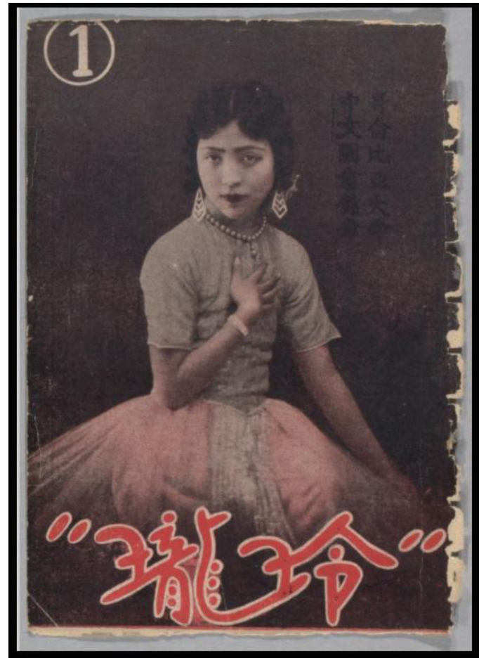
《玲瓏》001期封面

名媛本身家境殷實，且有較高的教育水平，活躍於交際圈；她們愛表達自己，所以樂於拍攝相片，並視登上雜誌封面為榮耀 17 。