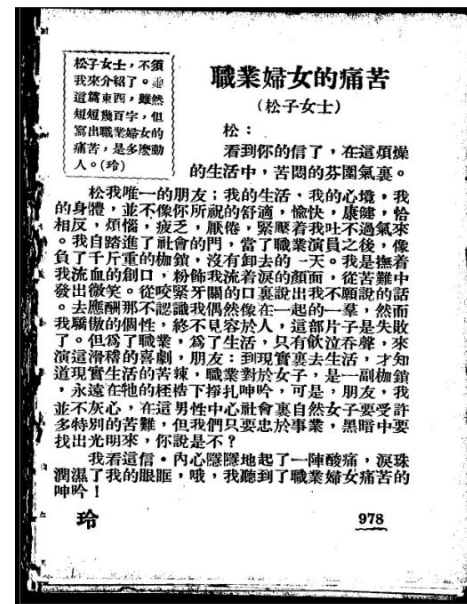
《玲瓏》100期〈職業婦女的痛苦〉