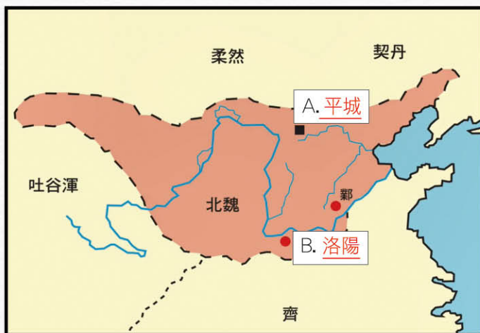
孝文帝遷都示意圖