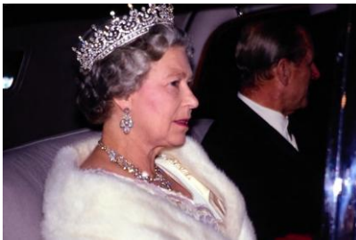
英女皇伊利沙伯二世