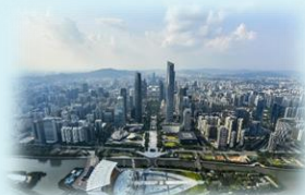
灣區城市考察活動