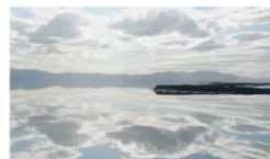
世界上最值錢的湖泊