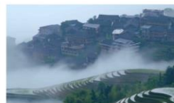
中國四大最佳旅遊鄉村