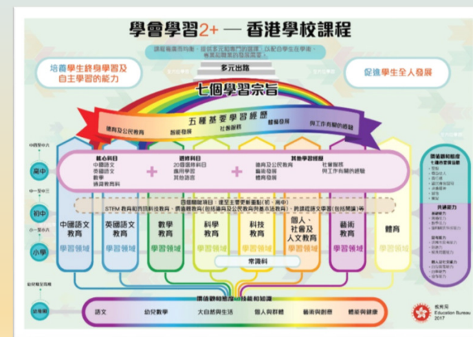
《中學教育課程指引》(2017)