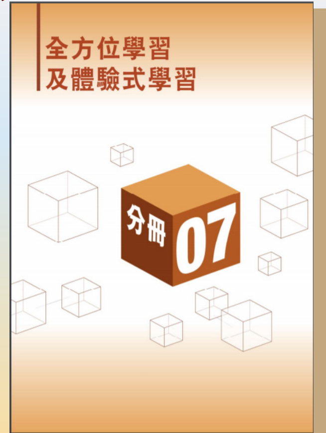
《中學教育課程指引》(2017) 分冊7：全方位學習及體驗式學習