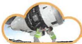
飛機工程夏日營 Aircraft Engineering Day Camp 26 – 30 July 2021 HKD 1,800