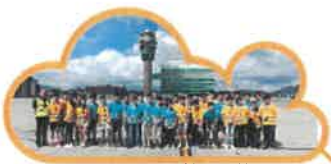
航空鑽FUN夏日營 Aviation Inside-out Day Camp 21 – 24 July 2021 HKD 1,500