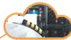
航空運輸夏日營 Air Transport Day Camp 2 – 6 August 2021 9 – 13 August 2021 HKD 1,800