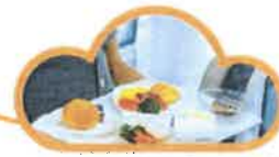
空中及地勤服務夏日營 Cabin Crew & Ground Services Day Camp 12 – 15 July 2021 HKD 1,350