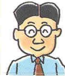
老師 社工 心理學家