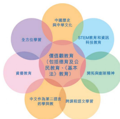
《中學教育課程指引》(2017)