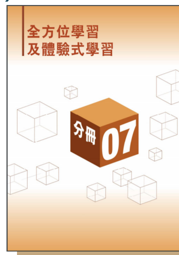
《中學教育課程指引》(2017) 分冊7：全方位學習及體驗式學習