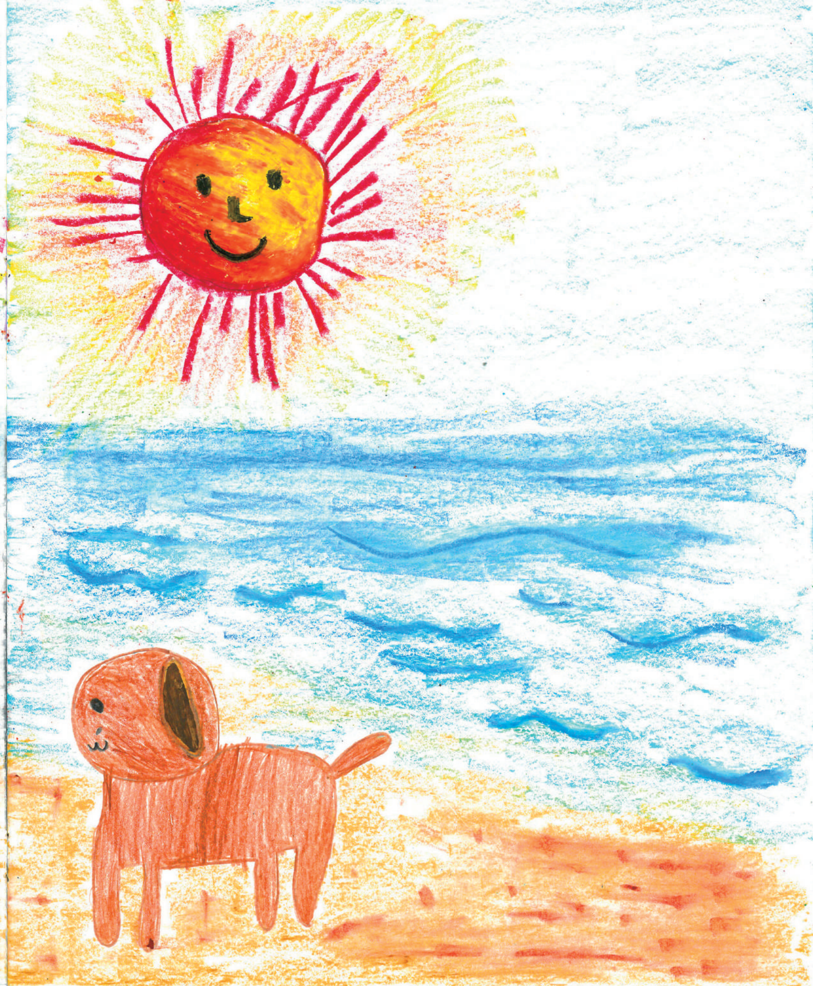
我們一家人開心地住在長洲。