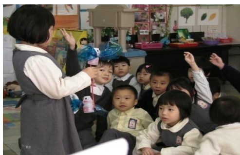
個案二：專題研習→自主的建構學習