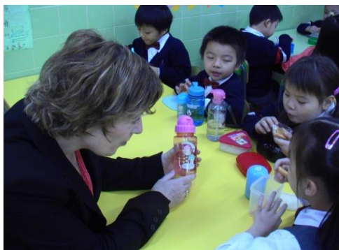
個案四：語文綜合→融入語境的英語接觸