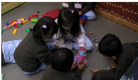
個案一：規劃彈性的日程→擴展幼兒探索空間