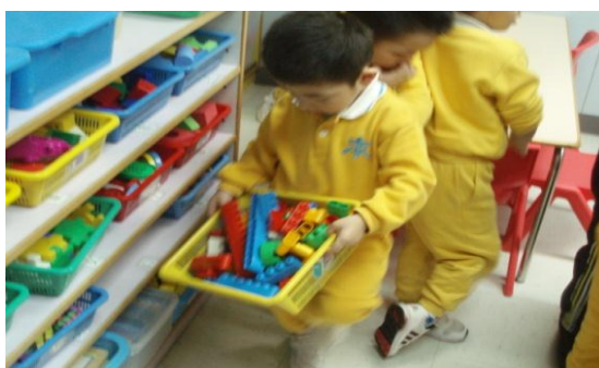
個案三：課程發展→推動全面的兒童評估模式