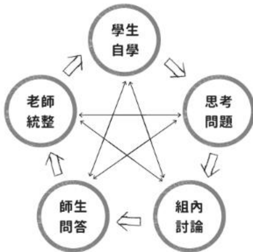
學思達教學步驟的可變性